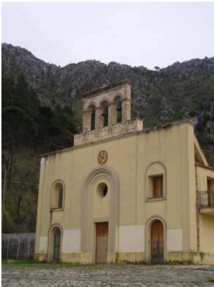
Chiesa di Romitello